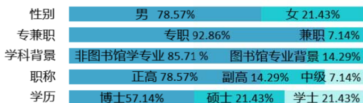
图3 2021年Z14高校图书馆馆长基本情况