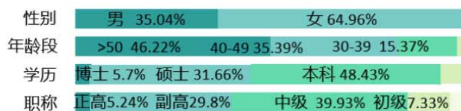
图4 2021年Z14高校图书馆在编职工基本情况

综合各方面情况，Z14高校图书馆的发展情况在全国高校图书馆界属于中等偏上水平，大部分可用于比较的指标高于全国平均值；在发展阶段上仍属于从传统图书馆向数字图书馆转型阶段；各馆之间发展很不均衡，资源共享不够活跃。亟需增加馆舍与文献资源投资、增加专业馆员、改变发展观念，加强信息化数字化建设，提升服务水平。