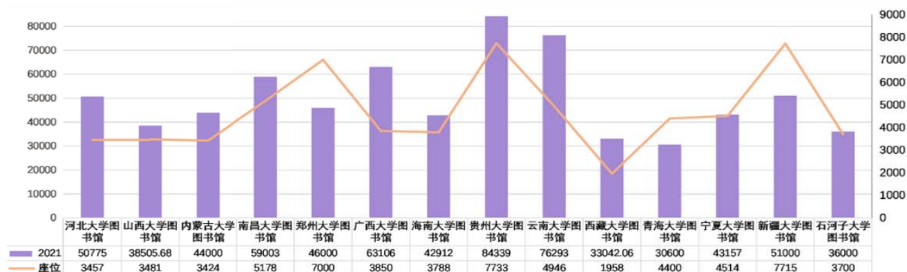
图2 2021年度Z14高校图书馆馆舍面积与空间服务对比