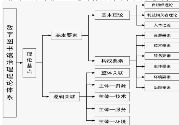
图2 数字图书馆治理理论体系

在对数字图书馆治理理论体系框架、构成要素以及要素间逻辑关联的分析的基础上,笔者提出以下数字图书馆治理理论体系构建的宏观框架(图2)。数字图书馆治理理论体系由数字图书馆治理理论的理论基点、基本要素与要素间的逻辑关联三部分组成。其中,理论基点,即逻辑起点,是协调数字图书馆多元要素间的协同与竞争关系。基础要素是对数字图书馆治理理论内容构成的系统阐述,侧重