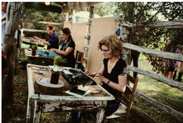
图1 2016年波士顿古旧书展诗歌打印比赛现场一角 [5]

帮助古旧书爱好者的古书鉴定活动;还设置有让公众体验怀旧情怀的活动,如使用老式打字机打印诗歌作品的竞赛等。