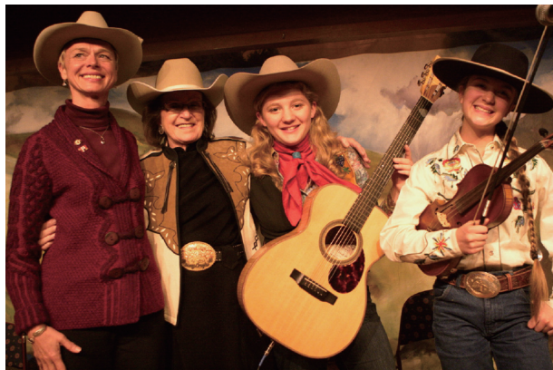
图4 全国牛仔诗歌聚会上的表演者 [19]

自豪。诗词的内容既包括讲述过去及现在的牛仔生活,如爱情、家庭、传奇故事、个人经历、自然风光、牧场工作等,也包括幽默轶事、挖苦现代生活中追求时髦的人等。