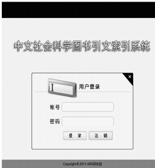
图1 《中文图书引文索引·人文社会科学》用户登录界面