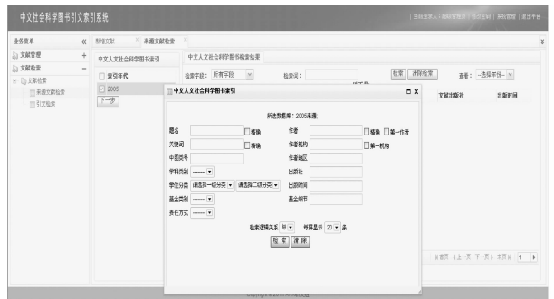
图5 《中文图书引文索引·人文社会科学》来源文献检索界面