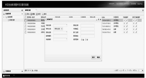
图3 《中文图书引文索引·人文社会科学》作者维护界面

称、作者名称、出版社、出版时间、学科分类、ISBN、中图分类号以及作者维护与被引文献维护两个添加与修改模块。文献检索模块包括来源文献检索和引文检索两个模块，来源文献检索可以提供图书唯一标识、文献名称、英文名称、副标题、ISBN、文献版本、文献出版社、文献出版地、丛书信息、关键词、基金细节等字段按照特定的年份进行检索；引文检索可以提供被引文献责任者、被引文献题名、被引文献出版社、被引文献年代、被引文献类型等字段检索。具体检索界面见图1—图6(注：此界面系示范数据库最初设计的界面，目前界面、系统题名等均有所修改)。