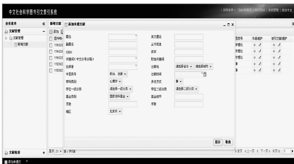
图2 《中文图书引文索引·人文社会科学》来源文献录入界面