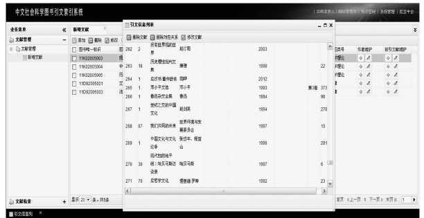
图4 《中文图书引文索引·人文社会科学》引文信息列表界面