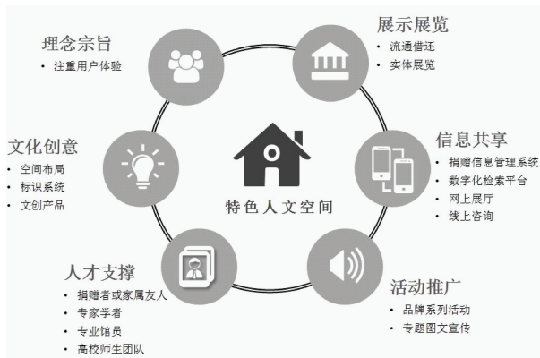
图2 特色人文空间服务体系

基于名人捐赠的大宗藏品构建特色人文空间, 是以固定舒适的场所空间为平台, 以特色文化内涵延伸出的服务、活动、产品为载体, 在丰富图书馆馆藏的基础上, 进一步强化服务学科研究、服务知识传播乃至服务社会教育的功能。因此, 在构建服务体系时要注重满足用户的多层次需求, 坚持用户体验至上。