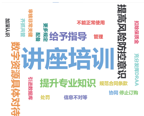
图3 调研对象对合同风险防控管理的主要建议

调研显示,几乎所有调研对象都认为有必要在引进国外数字资源过程中对合同风险进行管理。但目前馆员对合同风险防控措施的掌握情况却不容乐观,90.1%的调研对象表示未掌握系统的合同风险防控措施,79.21%的调研对象坦言所在图书馆从未举办过相关培训或指导。如图3所示,问卷最后设置的开放式问题收集到的建议也主要集中在加强合同风险防控的培训和指导。