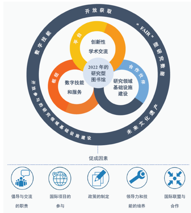
图 1 2018~2022 年 LIBER 发展战略架构

该战略包括五大重点发展领域(“开放获取”“FAIR”型研究数据”“数字技能”“开放参与的研究基础设施建设”“未来文化遗产”)和三大战略方向(“创新性学术交流”“数字技能和服务”“研究领域基础设施建设”),如图 1 所示 [10] 。其中,“数字技能和服务”战略包含了 LIBER 对数字人文与数字文化遗产工作的规划;通过完善与开发数字技能和服务,将图书馆打造成数字文化遗产与数字人文的枢纽。为此,LIBER 专门成立了数字人文与数字文化遗产(Digital Humanities & Digital Cultural Heritage, DH&DCH)工作组,以推进欧洲研究型图书馆开展数字人文相关工作。