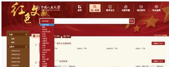
图 2 中国人民大学红色文献平台统一检索功能

红色文献平台聚合人大图书馆和上海图书馆等馆藏红色文献书目数据,未来项目二期计划将红色期刊、红色报纸、红色档案等多类型红色文献集成于平台,实现统一检索。平台支持全字段、题名、责任者、索书号、专题、馆藏地等多种方式检索(见图 2)。